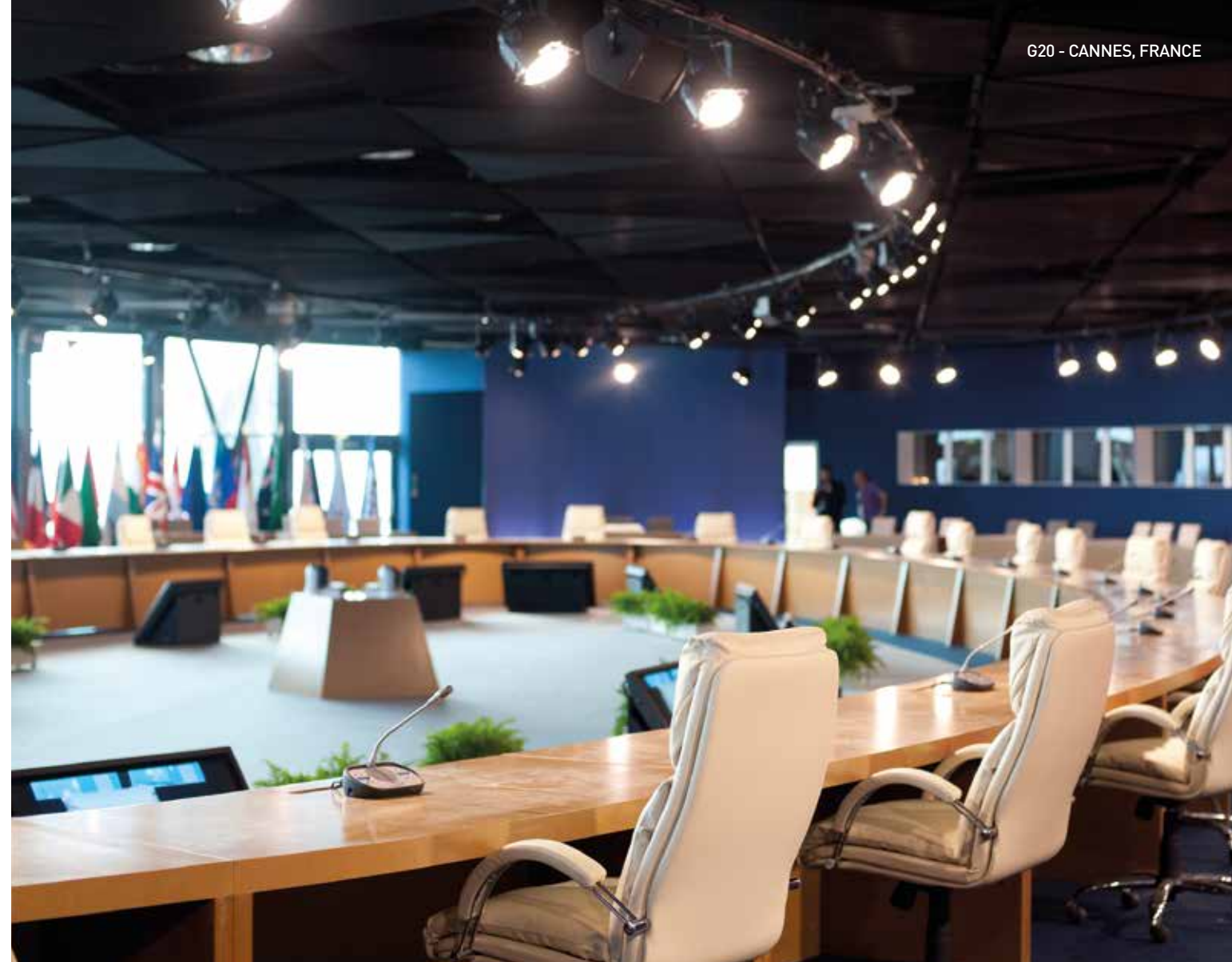
G20 - CANNES, FRANCE

Nous offrons une assistance multi-site et pouvons gérer plusieurs milliers de participants, permettant de vous concentrer sur d'autres problématiques.