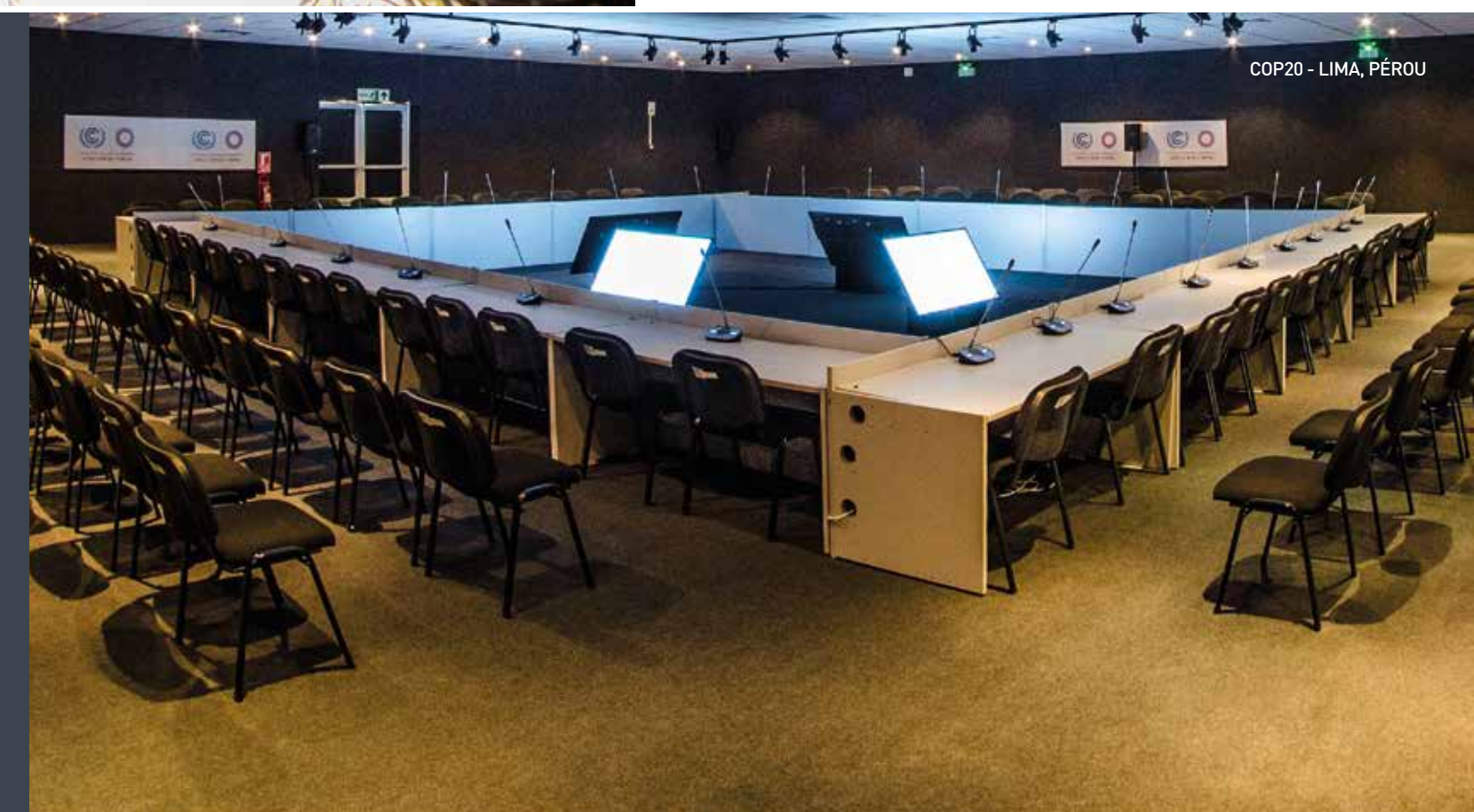
COP20 - LIMA, PÉROU

2 zones de plénière de 1 300 et 1 900 places