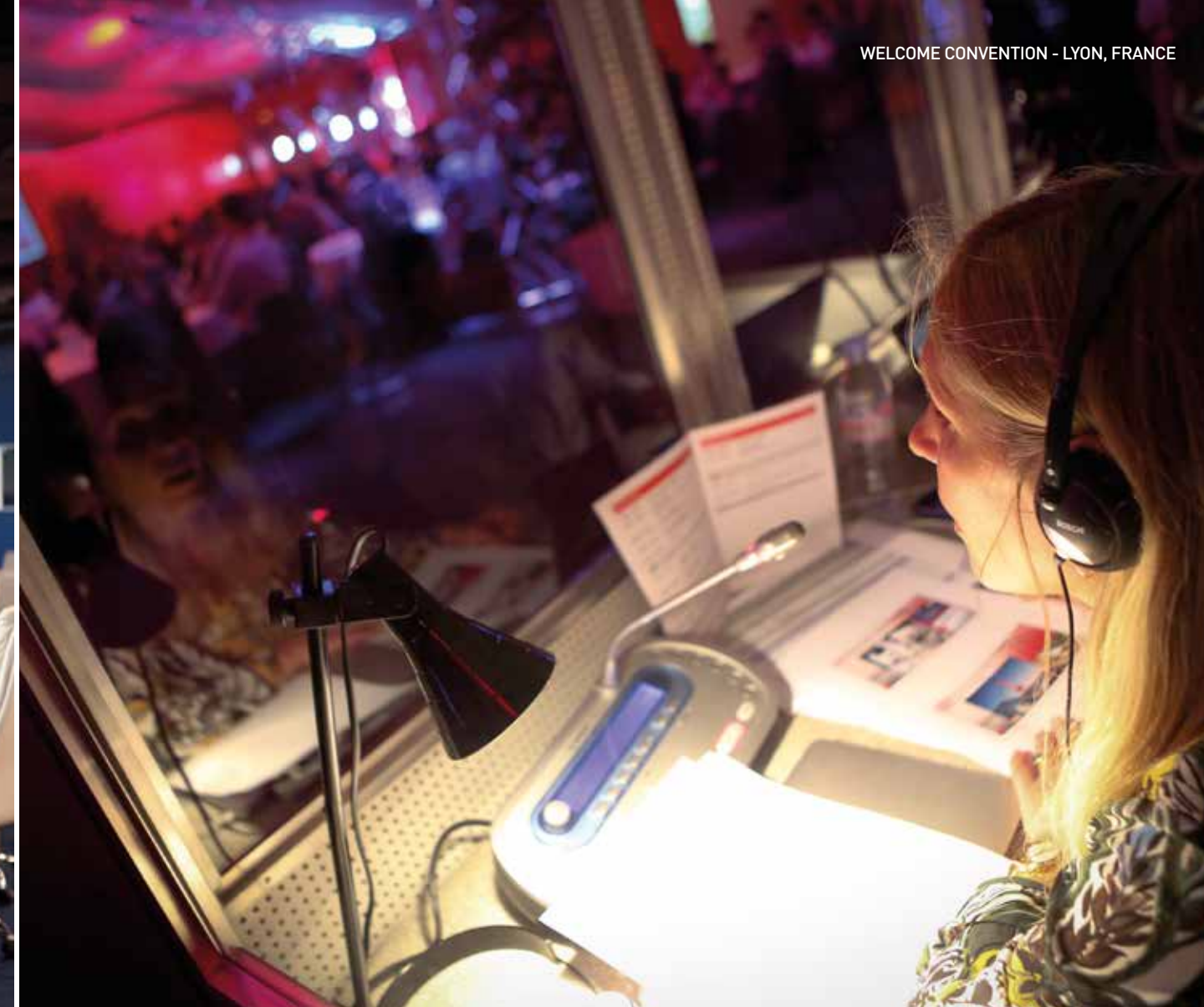
WELCOME CONVENTION - LYON, FRANCE